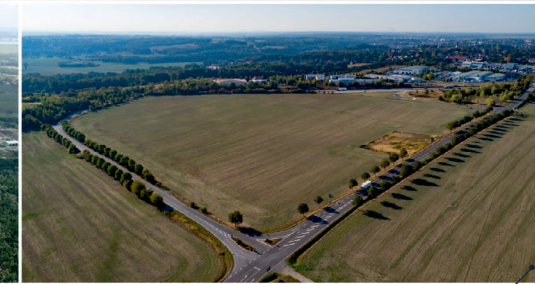
Gewerbe- und Industriegebiet Grimma Nord III