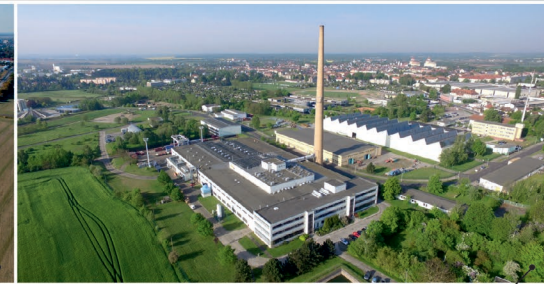
Gewerbepark Mittelstandszentrum Wurzen