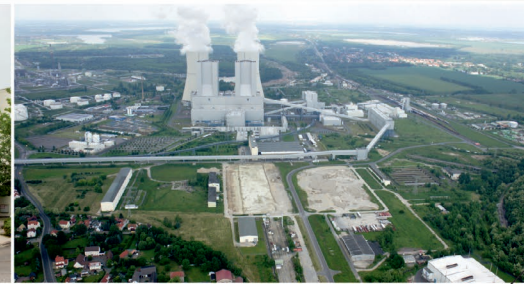
Industriegebiet Böhlen / Lippendorf