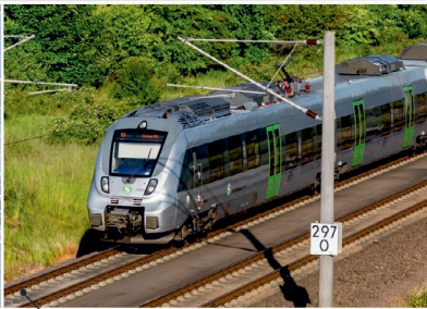
Vertaktetes Schienen- und Busnetz