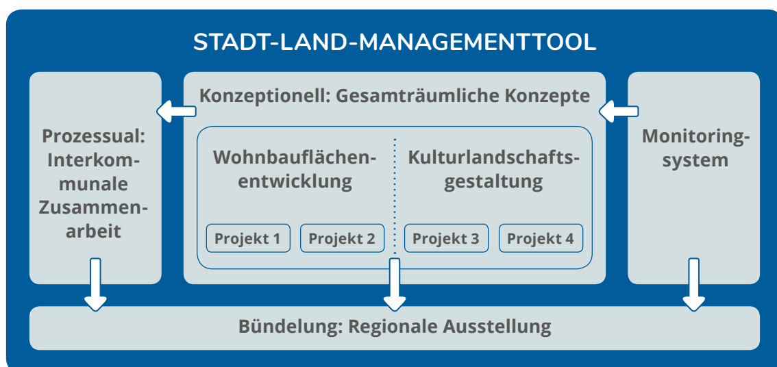
Abbildung: Konzeption des Stadt-Land-Managementtools

Ein Stadt-Land-Managementtool verknüpft die Analysen, Konzepte und Prozesse. Darüber hinaus enthält es ein System zur laufenden Beobachtung regionaler Entwicklungen sowie konkrete Projekte zur Aufwertung von Freiräumen und zur Entwicklung von Siedlungsstandorten.